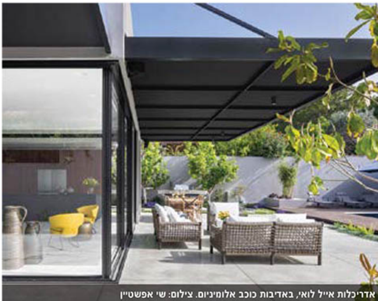
אדריכלות אייל לואי, באדיבות כוכב אלומיניום. צילום: שי אפשטיין