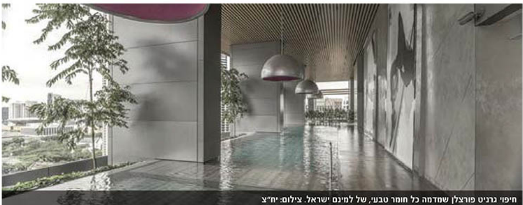
חיפוי גרניט פורצלן שמדמה כל חומר טבעי, של למינס ישראל.