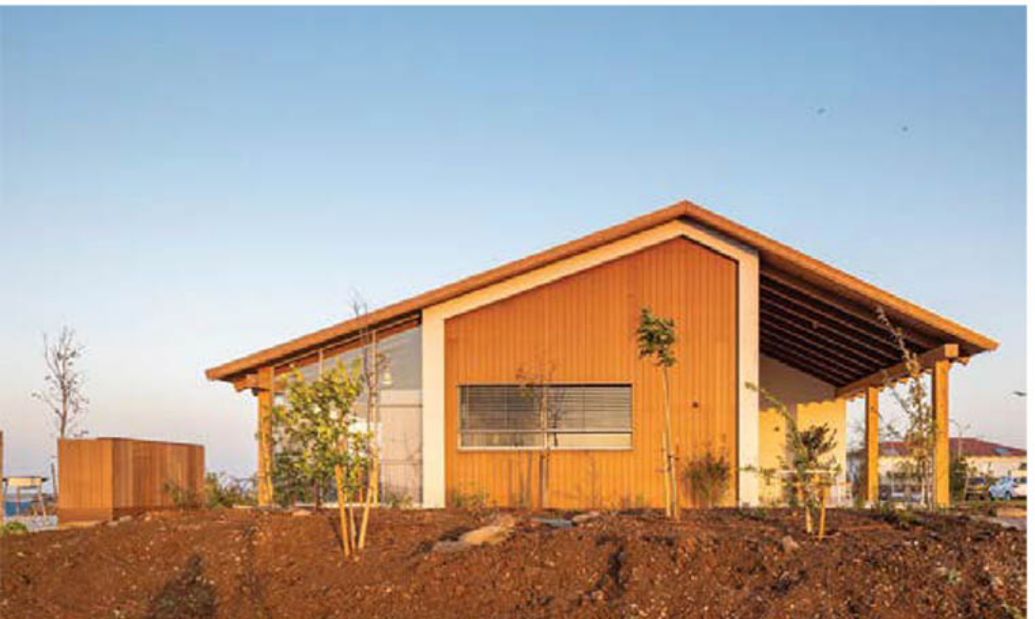
בתים בתכנון אדריכל ינון בן דוד.